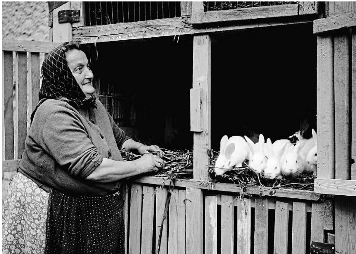
Kolik králíků je v této králíkárně? Skutečná matematika, jak píše autor, je umění tvořivě a správně myslet, být zvědavý a dokázat uspokojovat svou neustálou chuť přicházet věcem na kloub.

Přijímací test pro devátáky letos obsahoval tuhle úlohu. Všichni chlapci atletického oddílu se seřadili do zástupu podle velikosti. Před Petrem stála jedna osmina celkového počtu chlapců. Hned za Petrem stál jeho bratr Radek a za Radkem ještě pět šestin celkového počtu chlapců. Vypočtete celkový počet chlapců atletického oddílu. Záměrem autora úlohy bylo přivést žáky k sestavení lineární rovnice – o tom svědčí i podúlohy odpovídající dílčím krokům. Jenomže každý, kdo ví, že před Petrem stála osmina počtu všech kluků v zástupu, musí znát také jejich celkový počet. Jinak by přece nemohl o osmině mluvit. Tak proč by členy atletického oddílu, stojící v zástupu stejně jen kvůli úloze, počítal podobně nešikovně, jako matematická babička počítala králíky a slepice?